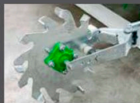
CAPTEUR DE VITESSE