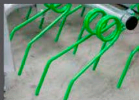
DENTS DE 10MM