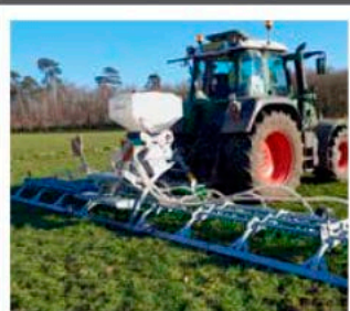
GREENKEEPER 6M + SEMOIR 300L Résultats parfaits dans les prairies