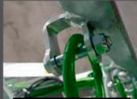
MANILLES DE TAPIS