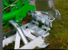
CHARNIÈRES ET PIEDS