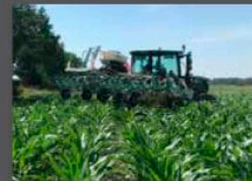
LEVER LA MACHINE