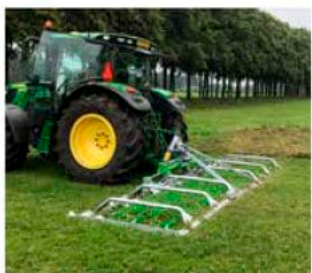
HERSES 6 MÈTRES 4 RANGÉES Complètement galvanisé à chaud

Herses 5 mètres 4 rangées Herses 6 mètres 4 rangées Herses 8 mètres 4 rangées