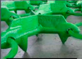
TAPIS LOURD (COMBI)