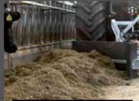
CAOUTCHOUC SANS ACIER