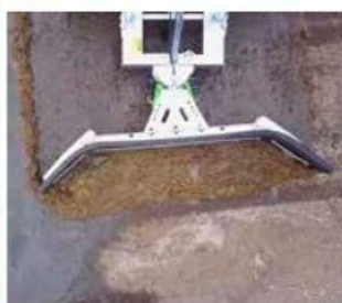
RACLEUR 270 HYDRAULIQUE Idéal pour l'entretien des allées et routes

Attelage 3-points 270 Standard Attelage 3-points 270 Hydraulique