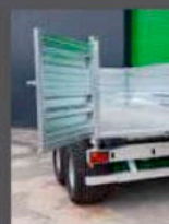
PORTE À 2