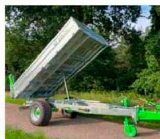
BENNE BASCULANTE SIMPLE ESSIEU Balance en arrière 50° (1 coté)

Z045 Benne Basculante Z050 Benne Basculante Z050 Benne Basculante tri-benne