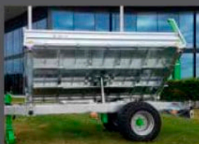
GALVANISÉ À CHAUD